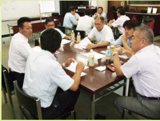
グループに分かれてディスカッション