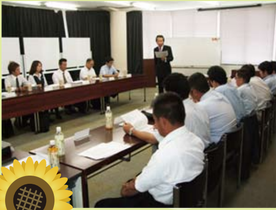
まずは皆で自己紹介

ポイントは「もっとCS(お客様満足度)をあげるには・・・」「新規のお客様にもっと店舗にお越しいただくには・・・」「お得意様にもっと店頭にお越しただけるようにするには・・・」など。