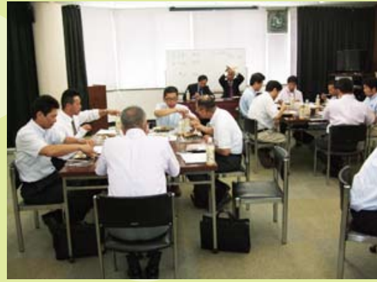
グループ毎にいろんな意見が・・・

普段、よりよいお店づくりにむけた話し合いの場は各々のお店内にとどまることが多く、他のお店と意見交換をする場は少ないのが現状ですから今日は貴重な一日。