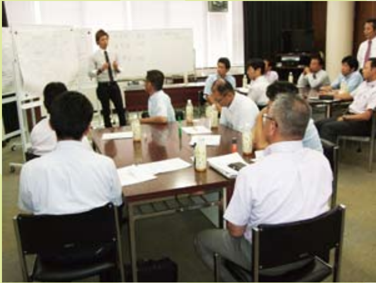
グループ討議の結果発表①

などなど、今後お店を更に良くしていくためのアイデアもたくさん出て大変盛り上がりました。