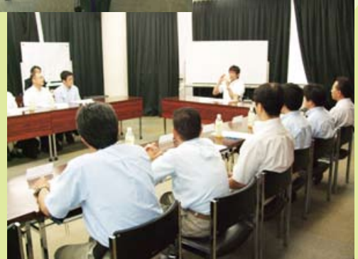
発声方法も学びました