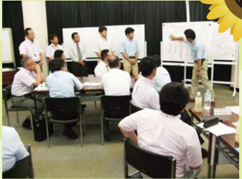
グループ討議の結果発表②